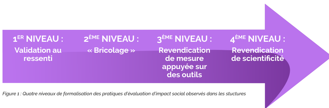
Figure 1 : Quatre niveaux de formalisation des pratiques d'évaluation d'impact social observés dans les structures

D'une manière générale, les entreprises à impact se saisissent de plus en plus de ce sujet. Le niveau de formalisation des dispositifs d'évaluation varie d'une organisation à l'autre. L'Avise, en partenariat avec l'Agence Phare, présente ainsi un continuum de pratiques de l'évaluation de l'impact social 23 . Ce continuum est réparti en quatre niveaux :