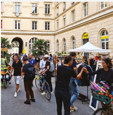
© BASE COMMUNE - LES ARCHES

Agir avec son épargne solidaire, c'est concret ! Chaque initiative soutenue sur le terrain contribue à une économie plus humaine, une société plus inclusive et un monde plus juste.